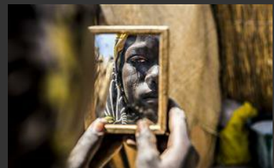
Emergenze nel mondo. In 12 scatti il "meglio" e il "peggio" dell'anno di Msf