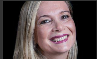
Life is woman: i sorrisi delle donne che hanno vinto il cancro