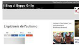
Grillo vale di più del blog M5S. Si porta dietro migliaia di link, ma non i post zavorra