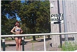
Torino, viaggio nelle baracche del sesso