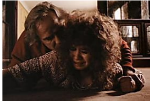
“Ultimo Tango a Parigi” fa scandalo, così è stata girata la scena del burro