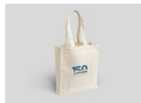
Borsa Shopper La Stampa 150° Anni