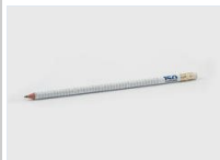
Matita La Stampa 150° Anni