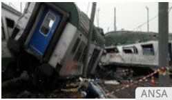
Poca manutenzione e treni vecchi. Quella linea dannata della Lombardia Urla e pianti, quei 2 minuti eterni | Chi sono le vittime Commento - I martiri dell'Italia che fatica