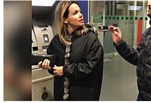
La moglie di Bonolis va al bancomat: “Che ci faccio con 30 euro?”