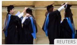
Rivoluzione rosa a Oxford. Le matricole sono ragazze