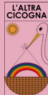
Associazione L'altra Cicogna