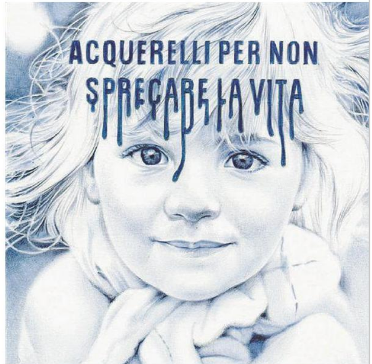
Acquerelli per non sprecare la vita, un'opera di Giuseppe Stampone per la mostra "Diritto e rovescio"