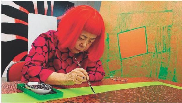
Yayoi Kusama, considerata la più nota e influente artista giapponese vivente, al lavoro nel suo studio