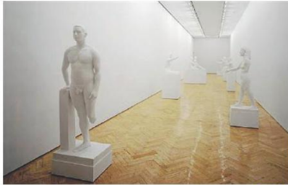
Un'opera di Marc Quinn esposta nella mostra virtuale sul sito Opl.it

La speranza Nei dibattiti online ritrovo il clima dei caffè artistici dove sorsero gruppi e movimenti