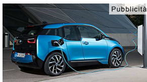
Auto Ibride - Link...

Ecco quanto dovrebbe costare un impianto dentale in Croazia