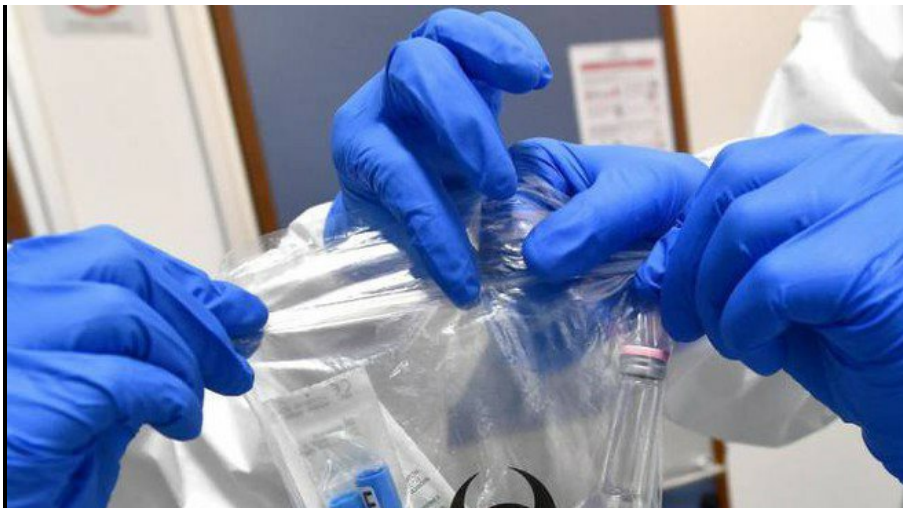
Emergenza coronavirus

Milano, 1 marzo 2020 - Gli psicologi lombardi scendono in campo per sostenere i cittadini nell' emergenza coronavirus . Come sottolineato dall' Ordine degli psicologi della regione - la più colpita dall'emergenza Covid-19 - sono tante le dimensioni di tipo psicologico ed emozionale che stanno emergendo in questa fase: "paura per la propria salute, preoccupazione per i familiari, rottura repentina della routine quotidiana, incertezza sul futuro, difficoltà a valutare il livello di rischio dell'emergenza e a gestire la complessità delle informazioni sanitarie". Se è fondamentale avere cura degli aspetti sanitari e medici bisogna prestare grande attenzione "al senso di sicurezza, al benessere e della capacità di far fronte a questa situazione della popolazione". E' per questo che l'Ordine degli psicologi della Lombardia ha ideato la campagna social #LoPsicologoTiAiuta , per sottolineare che ci sono specialisti che si occupano di aiutare le persone a mantenere il proprio equilibrio e benessere di fronte a situazioni di difficoltà e incertezza .