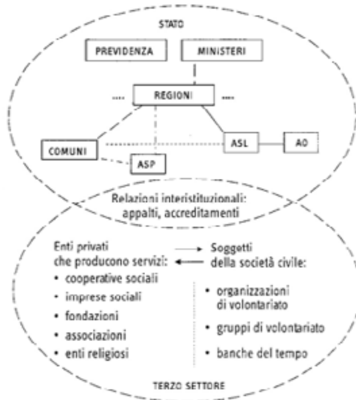
Figura 8.3 Mappa della rete istituzionale dei servizi

La rete dei Servizi sociali alle persone è molto diversificata, come evidenziato dalla mappa sottostante (Ferrario, 2014).