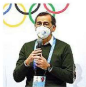
A Pechino Beppe Sala in Cina

Nel centro nevralgico dei Giochi Internazionali cinesi, scorrono immagini (italianissime) da cartolina: le Dolomiti, Venezia, il Duomo, le montagne della Valtellina. Tra i presenti, insieme a tanti campioni dello sport di ieri e di oggi, il sindaco Beppe Sala. Andato in Asia a promuovere il «modello Milano» perché torni a essere il «place to be».