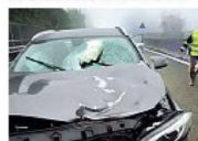
Distrutta l'auto dell'investitore

Travolto 43enne Era contromano sul raccordo A8