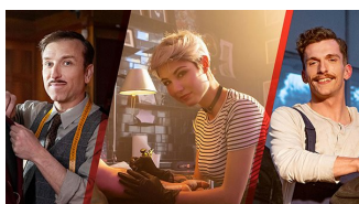
REPOWER Prezzo fisso, variabile o misto: scopri la fornitura elettrica e gas adatta a te!