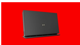
PROMO ONLINE VODAFONE Passa a Fibra a 27,90€ al mese. Tutto incluso!