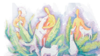
ALMO NATURE 3 azioni concrete di Almo Nature a favore di cani, gatti e famiglie